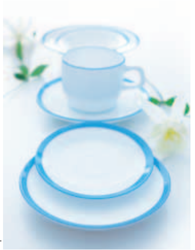
Aléa Opal blanc

A set of extremely shock-resistant dishes that have been designed to meet all catering needs. Attractively decorated with a thin "hand painted" stripe, the Aléa collection has been created to maximise all available Surfaces (thanks to its small rim) and is dishwasher-proof in professional washers.