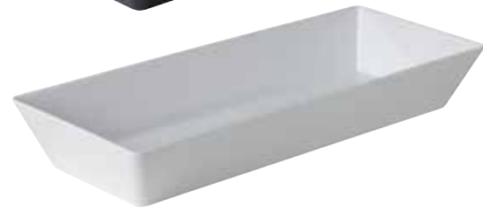
2. Rechthoekige bakken smal