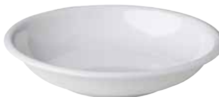
7. Ronde schaal