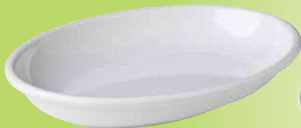
5. Ovale schaal