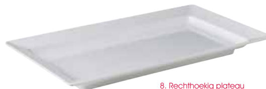
8. Rechthoekig plateau