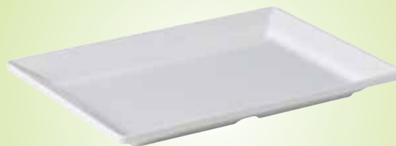
5. Rechthoekig bord

bespaar aanzienlijk op uw breuk met ons assortiment