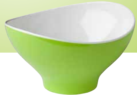
4. Ovale kom Lime groen &amp; Wit