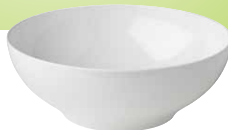
6. Ronde bakken