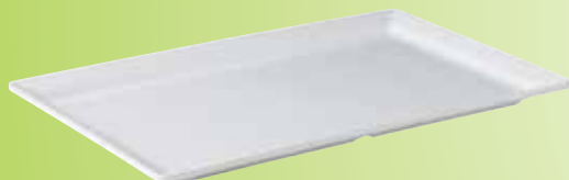
5. Gastronomplateau met smalle rand