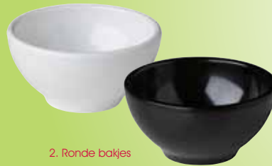
2. Ronde bakjes