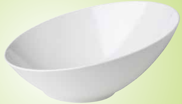
1. Schuine schaal