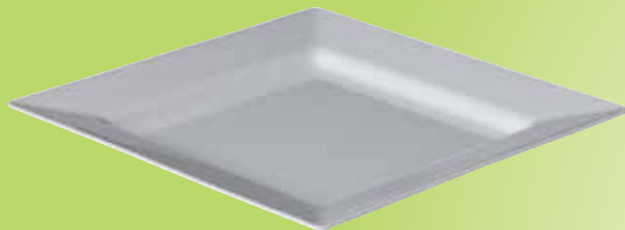
4. Vierkant bord