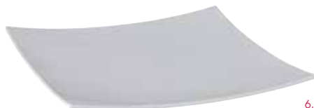
6. Gebogen vierkant plateau