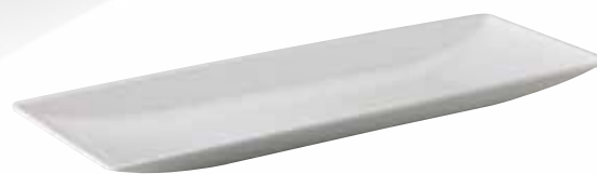
5. Bootvormig plateau