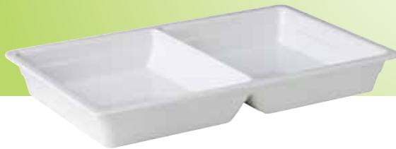
2. 1/1 Gastronormbak met 2 compartimenten