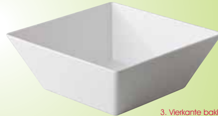
3. Vierkante bakken