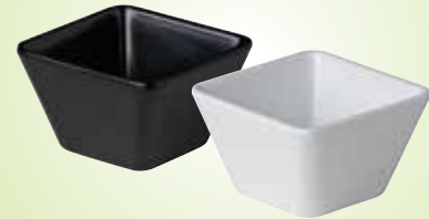
3. Vierkant bakjes