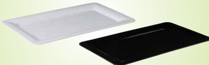
7. Gastronomplateau met brede rand