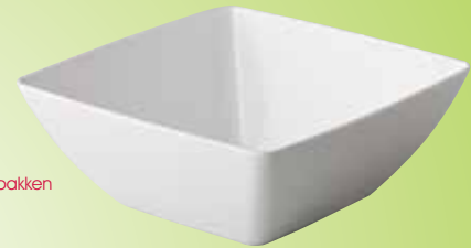
4. Gebogen vierkante bakken