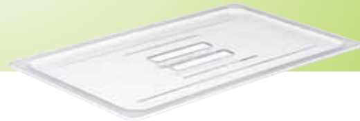
3. Gastronormdeksel met handvat