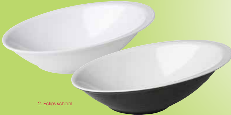
2. Eclips schaal