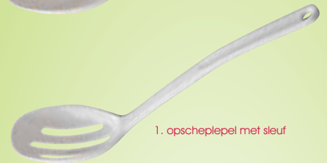
1. opscheplepel met sleuf