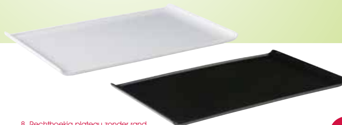
8. Rechthoekig plateau zonder rand