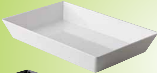
1. Rechthoekige bakken