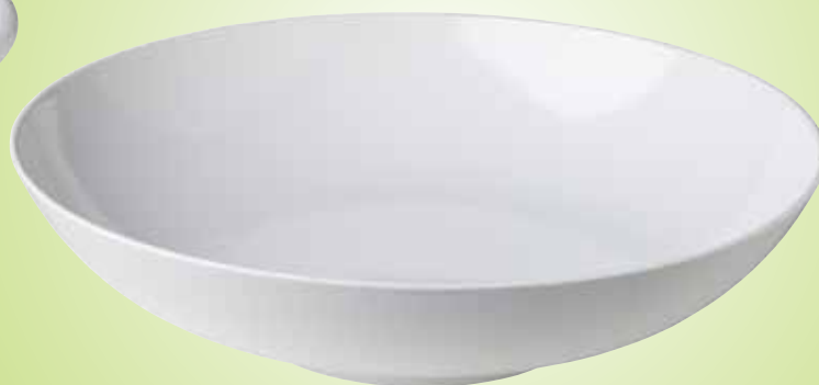
8. Grote ronde schaal

zorgvuldig geselecteerd, conform Europese standaarden