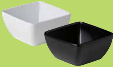
1. Gebogen vierkant bakjes