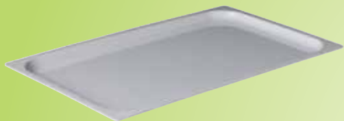
4. Gastronomplateau budget