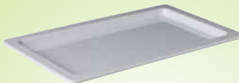
6. Gastronomplateau's diep