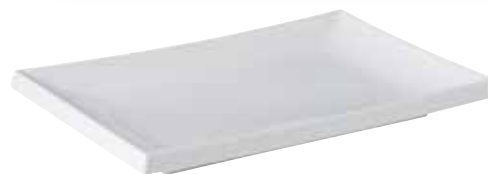
7. Sushi bord