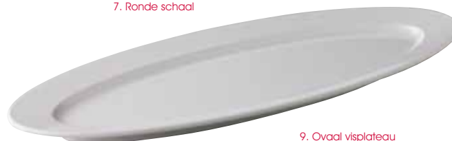
9. Ovaal visplateau