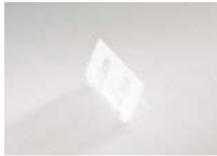
Kaarthouder om te clippen