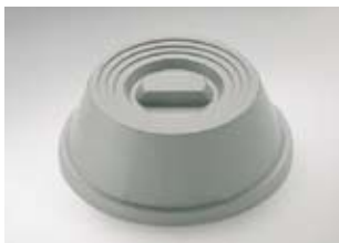
Cloche, PP/C 7,75“

Enkelwandig, voor borden diameter 190 mm