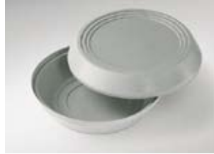
Warmhoud-bovengedeelte, PP/C, „IS-O-EI“

Voor eenpansschalen diameter 190 mm Dubbelwandig, vrij van CFK geschuimd