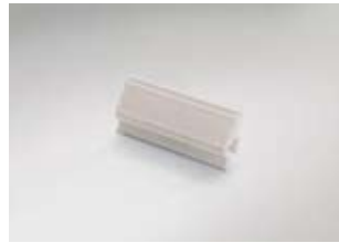
Kaarthouder bij Thermotray