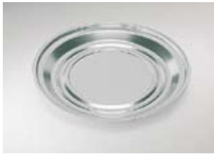
Warmte-/koelsleutel, rvs, SJ-255

Dubbelwandig geïsoleerd, aluminium kern, bord opliggend diameter 255 mm, eenpansschalen diameter 190 mm