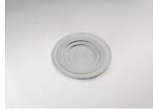
Terrinedeksel, voor soepterrines van porselein