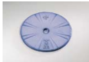
Koepellet PP, blauw

Bijbehorend kunststof onderdeel: Bestelnr. 89 08 02 66 sering Bestelnr. 89 08 02 82 lichtgrijs