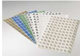
Kleursymboolsticker Vellen à 100 stuks