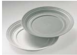
Warmhoud/koelschotel, PP/C, IS-UTEL

Dubbelwandig, vrij van CFK geïsoleerd Bord opliggend diameter 255 mm, Eenpansschalen diameter 190 mm