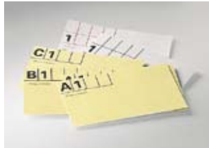
Patiëntenkaarten à 100 stuks