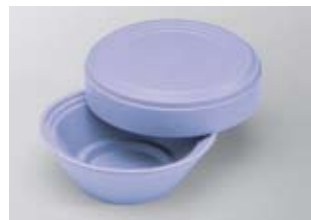
Warmhoud-bovengedeelte, PP/C, „IS-O-BO“

Voor morsbestendige soepschaal Dubbelwandig, vrij van CFK geschuimd