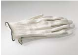
Katoenen handschoen 5 vingers