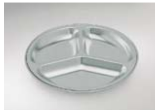
RVS inzetbord 3-delig bij verwarmingsschotel SC-2, diep

Bijbehorende verwarmings- schotel (SC2 diep): Bestelnr. 89 08 01 16 Bijbehorende cloche SC-2: Bestelnr. 89 08 01 13