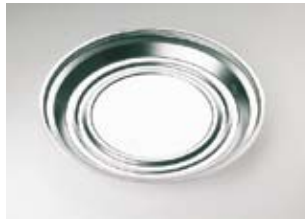
Warmteschotel, rvs, „Ultra“ SJ-255

Dubbelwandig, hoge warmteopslag- capaciteit Bord opliggend diameter 255 mm, Eenpansschalen diameter 190 mm