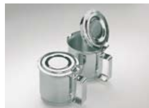
Portiekannetje rvs, cilindrisch

Kannetje en scharnierdeksel dubbelwandig