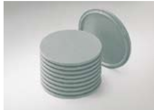
Terrinedeksel, voor soepterrines van porselein