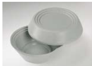
Warmhoud-bovengedeelte, PP/C, „IS-O-BO“

Voor soepterrines diameter 130 mm Dubbelwandig, vrij van CFK geschuimd