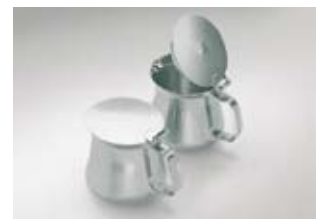
Portiekannetje rvs, „Hotel“

Kannetje en scharnierdeksel dubbelwandig