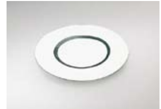
Deksel voor soepterrines, rvs