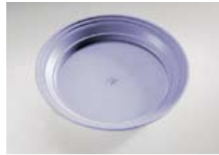
Kunststof ondergedeelte PP voor koepellet inzetstuk

Dubbelwandig, vrij van CFK geïsoleerd Bord opliggend diameter 255 mm