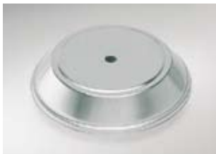
Cloche, rvs bij SJ-255

Enkelwandig, met vingergat, zonder/met groef voor eenpansschaal