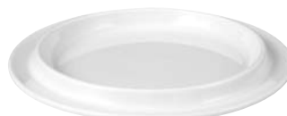
Porzellanplatte (Ø 180 mm) 5120 - 18