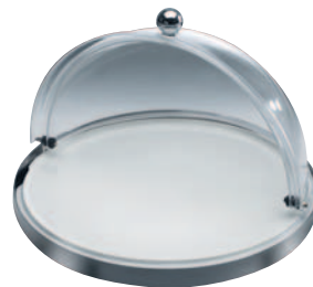
Porzellanplatten (Ø 400 mm) Kühlstandfuß aus Edelstahl (E 625 E) und Haube (E 546 E)