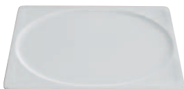
2/3 GN Porzellanplatte 5120 - 2/3