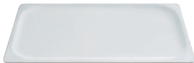
1/1 GN Porzellanplatte 5120 - 1/1