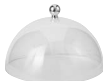
Haube (Ø 180 mm) Model Edelstahl (EB 383 E) Model Gold (EB 383 G)