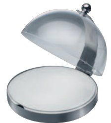
Porzellanplatten (Ø 300 mm) Kühlstandfuß aus Edelstahl (E 626 E) und Haube mit Haubenhalterung (E 543 E)