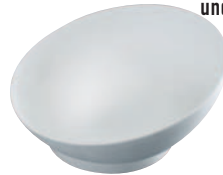
groß 5120 - 30/15