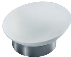
Porzellanschalen Kühlstandfuß aus Edelstahl (Ø 180 mm) EB 627 E