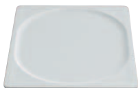
1/2 GN Porzellanplatte 5120 - 1/2