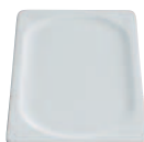
1/3 GN Porzellanplatte 5120 - 1/3