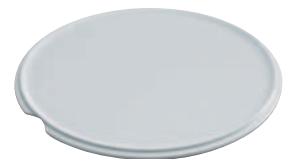
Platten Ø 300 mm 5120 - 30 Ø 400 mm 5120 - 40