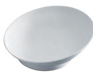
klein 5120 - 28/11