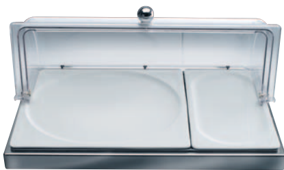
GN Porzellanplatten Kühlstandfuß aus Edelstahl (EB 624E) und Haube (10078)

Schön kühl. Edelstahl und Porzellan mit System.